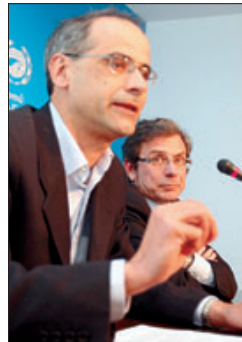
► Presentació de la col·lecció.